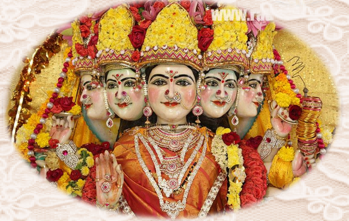
గాయత్రీ మాత ప్రశాంతి నిలయం

ఓం భూర్భువస్సువః తత్సవితుర్వరేణ్యం భర్గో దేవస్య ధీమహి ధియో యోనః ప్రచోదయాత్.