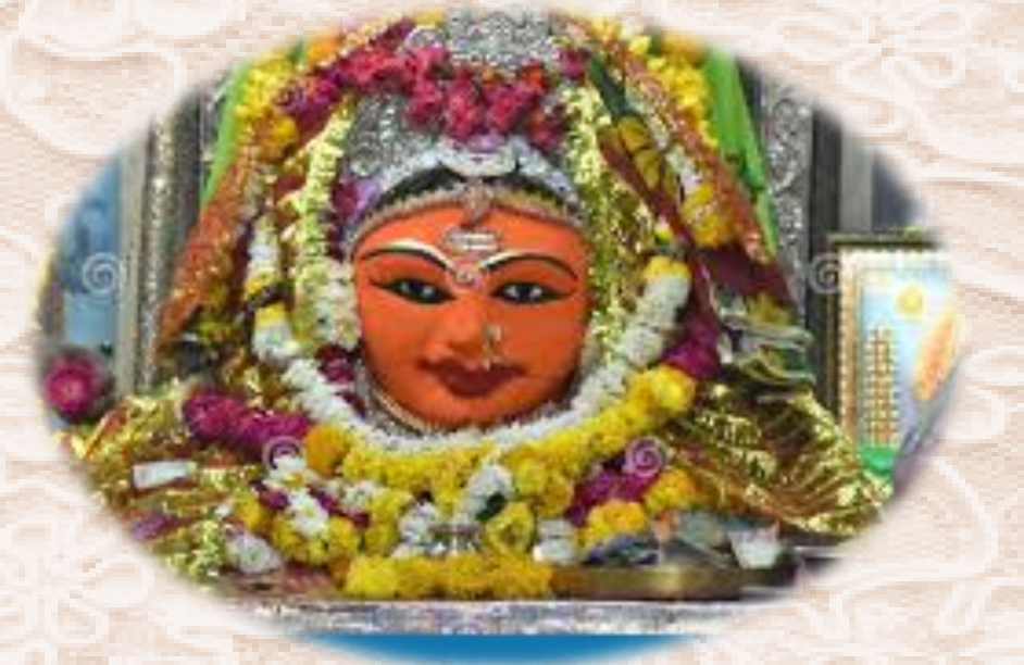
గాయత్రీ మాత ఉజ్జయిని

గాయత్రీ మాత ముఖములతో కూడుకొని వుండును కనుక “పంచముఖీ” అని మరొక పేరు. ఈ ఐదు ముఖములు పరబ్రహ్మ యొక్క ఐదు అంశములను సూచిస్తాయి. అవి