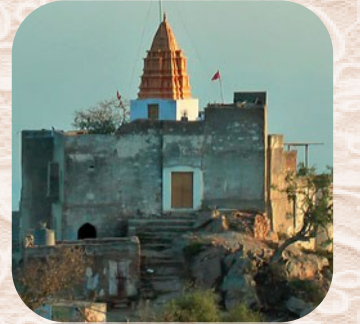
గాయత్రీ టెంపుల్, పుష్కర్